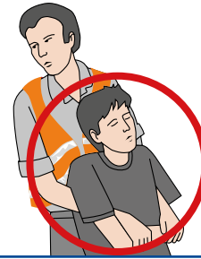
Person ggf. aus dem Gefahrenbereich retten