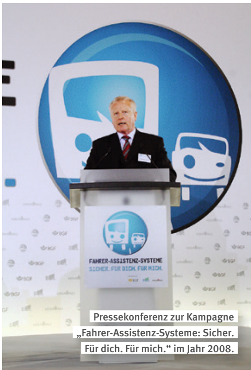
Pressekonferenz zur Kampagne „Fahrer-Assistenz-Systeme: Sicher. Für dich. Für mich.“ im Jahr 2008.