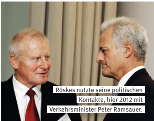
Röskes nutzte seine politischen Kontakte, hier 2012 mit Verkehrsminister Peter Ramsauer.