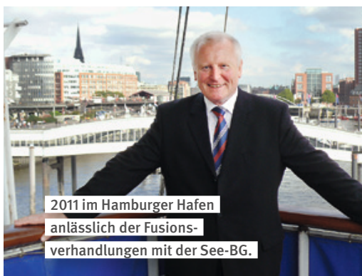
2011 im Hamburger Hafen anlässlich der Fusions- verhandlungen mit der See-BG.