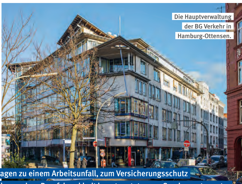
Die Hauptverwaltung der BG Verkehr in Hamburg-Ottensen.