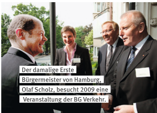
Der damalige Erste Bürgermeister von Hamburg, Olaf Scholz, besucht 2009 eine Veranstaltung der BG Verkehr.