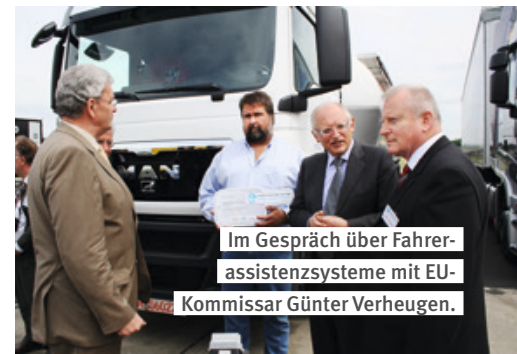
Im Gespräch über Fahrerassistenzsysteme mit EU-Kommissar Günter Verheugen.

Das kann ich Ihnen genau sagen: In den Verbänden kann man Forderungen aufstellen und diese dann auch beschließen. In der BG Verkehr sieht das etwas anders aus. Wir haben als Arbeitgeber nur 50 Prozent der Stimmen. Die anderen 50 Prozent hat die Arbeitnehmerseite. Wenn ich etwas erreichen möchte, muss ich die Vertreter und Vertreterinnen der Arbeitnehmer überzeugen und, falls nötig, einen Interessenausgleich finden. Das ist das Spannende: Man kann nicht einfach beschließen, sondern muss